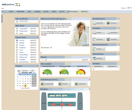
Startsidan där färger och logotyp kan kundanpassas

I installationspriset ingår en heldags utbildning och genomgång då vi tillsammans går igenom strukturen och hur systemet fungerar. Sedan är ni redo att sätta igång arbetet med att förbättra er verksamhet.